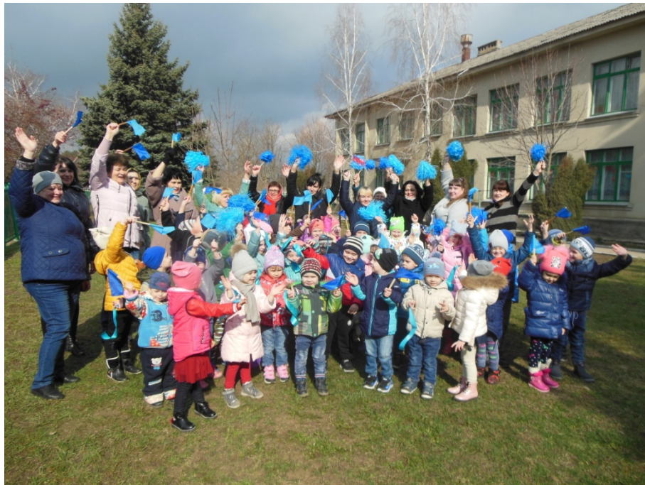
Акция «Сбереги дерево – сдай макулатуру!»