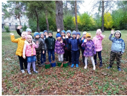
Флешмоб «Сбереги деревья!»