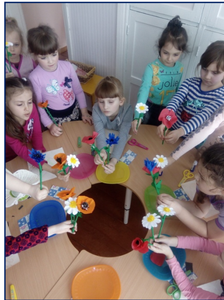
Совместная с волонтерами МБОУ СОШ № 7 квест-игра «Берегите лес»